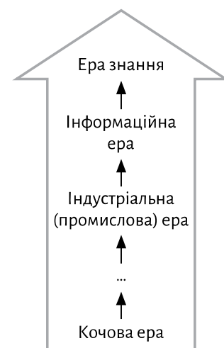
Рис. 1. Послідовність розвитку економіки

Кожен етап умовно можна назвати ерою. Якщо заглянути вглиб віків, виявимо, що економіка почалася з «кочової ери», де джерелом багатства і благополуччя була фізична сила і здатність виживати, своєрідні нематеріальні активи. Від XIX століття і до середини XX століття в світі панувала індустріальна ера. За нею настала інформаційна. Відоме прислів'я «Хто володіє інформацією, той володіє світом» дуже точно характеризує цей етап розвитку економіки. Внаслідок розвитку інтернету й інформаційних технологій ця ера проіснувала порівняно недовго, оскільки зберегти цінну