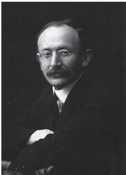
Іл. 34. А. Левітан. Фото. Кін. 1910-х – поч. 1920-х