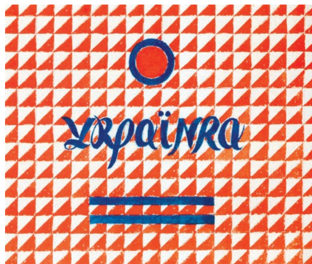
Іл. 124. В. Єрмілов. Ескіз коробки для цигарок «Українка». Пап., накл. на пап., гуаш