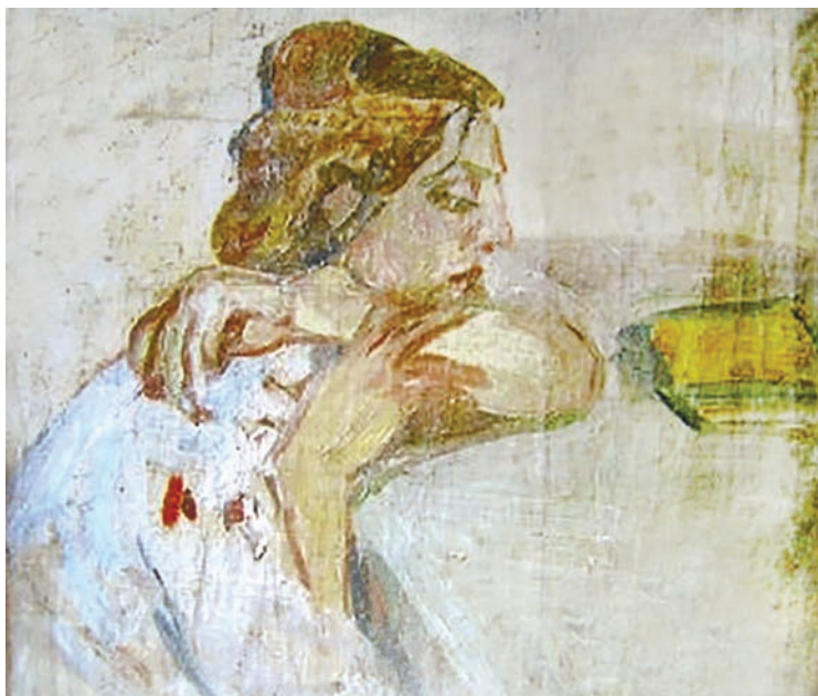
Гл. 100. М. Федоров. Етюд.