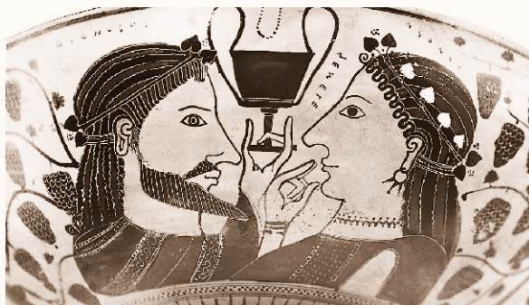
Дионис делит кубок вина со своей матерью Семелой

Жрица Зевса Семела была чарующе прекрасна, так что Зевс немедленно решил ее соблазнить. Естественно, бог явился к ней в облике смертного. Забеременев, Семела спохватилась и стала задаваться вопросом, действительно ли ее галантный и сладкоречивый любовник был человеком. Она потребовала, чтобы Зевс явился к ней в своем истинном облике. Бог, связанный обещанием выполнять требования женщины, неохотно согласился. Увидев его в сиянии истинной славы, Семела немедленно сгорела и превратилась в головешку.