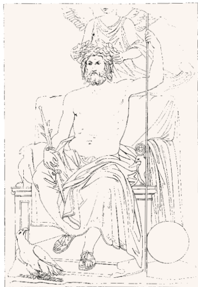
Могучий Зевс с молнией и орлом, в венке победы

По воле, мальчик, Зевса тяжкогромного Конец приходит к смертному. Не сами мы Судьбу решаем нашу. Кратковечные, Как овцы, мы проводим жизнь, не ведая, Какой конец нам бог готовит каждому. Семонид Аморгосский, Доля смертных, 1 (1)