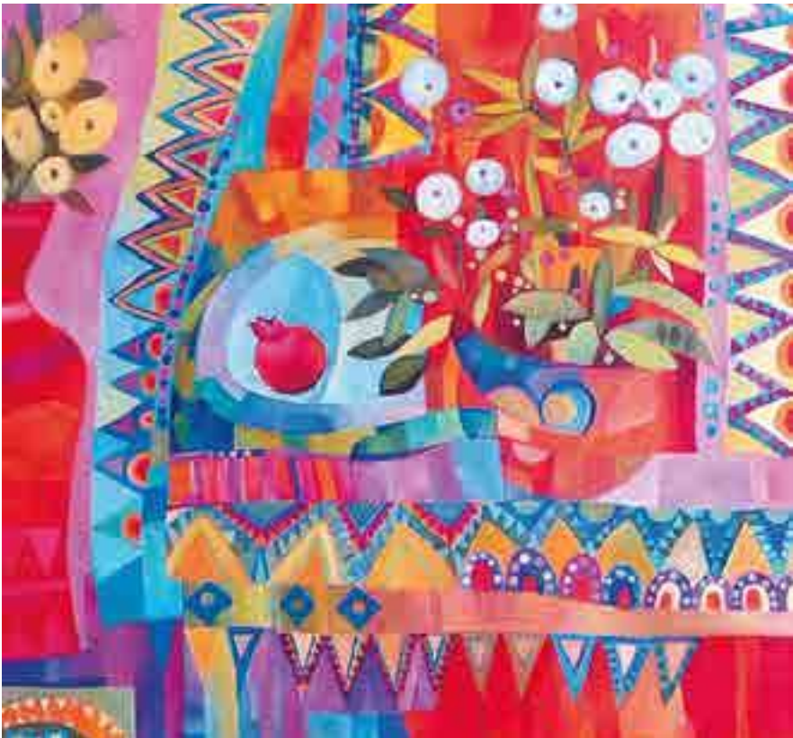
Ірина Колесникова. Натюрморт з гранатом

!? Розгляньте декоративний натюрморт і визначте засоби художньої виразовості. З'ясуйте композиційні й колористичні особливості твору. Зверніть увагу на те, як мисткиня стилізувала зображення. Чи відчувуються в картині східні мотиви? Поміркуйте, яка роль ритму, орнаменту в композиції. Як впливає цей твір мистецтва на ваш настрій? Поділіться з друзями й подругами своїми враженнями.