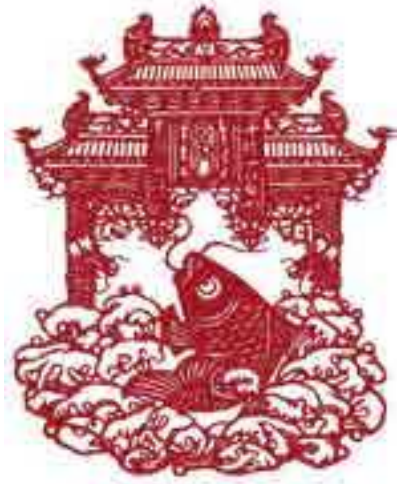
Китайська витинанка — цзяньчжі

У Японії мистецтво вирізання з паперу називають кіригамі ( кіри — різати, гамі — папір). У техніці кіригамі створюють різноманітні речі — від фігурок і об'ємних листівок до цілих архітектурних споруд.