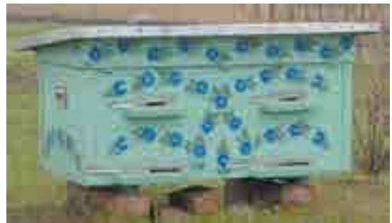
Роботи переможців конкурсу «Петриківка очима сучасної молоді»