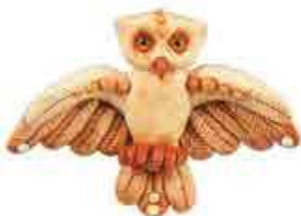
Іграшка з тіста