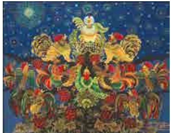
«Ще треті півні не співали»