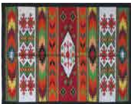
Гуцульський килим (Прикарпаття)