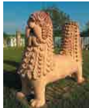
Керамічна скульптура лева на території Національного музею-заповідника українського гончарства

Під час канікул здійсніть екскурсію в Опішню — столицю українського гончарства.