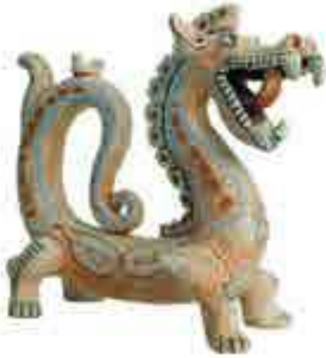
Узбецька керамічна іграшка

У різних країнах, зокрема в Україні, створено музеї іграшок. У лондонському Музеї дитинства зібрали іграшки різних часів з усіх частин світу. З-поміж тисячі експонатів — ляльки й колекції одягу та меблів для них, настільні ігри, конструктори, пазли тощо.