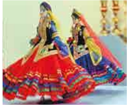
Ляльки в національних костюмах

У культурі країн Близького Сходу, як і в інших країнах світу, декоративно-ужиткове мистецтво відіграє надзвичайно важливу роль. Саме в художніх ремеслах яскраво виражаються давні мистецькі традиції, які нерозривно пов'язані з побутом. Декоративна орнаментика завжди відігравала важливу роль у тканинах і килимах, керамічних і металевих виробках.