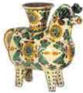
Павлина Цвілик. Підвазонник «Баран» (косівська кераміка)

Відмінна риса косівської (гуцульської) мальованої кераміки, внесеної до списку духовної спадщини ЮНЕСКО, — триколірність зображення: зелені, жовті, коричневі кольори на білому тлі.