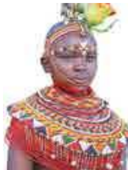
Африканські прикраси з бісеру

На прикладі творчості народів Африки можна простежити, як у виробах декоративно-ужиткового мистецтва втілюються своєрідні етнічні культурні особливості.