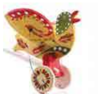
Яворівська дерев'яна іграшка