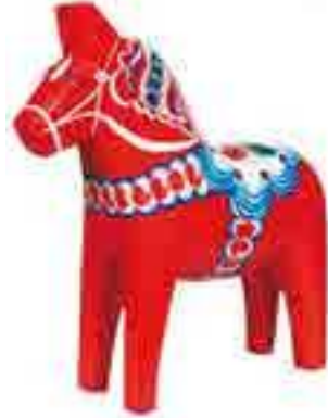
Шведська дерев'яна іграшка — конячка Дала