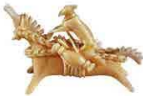
Іграшка із сиру