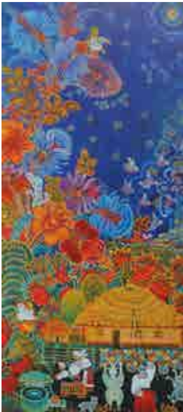
«Я хотіла побачити місто...» (фрагмент)