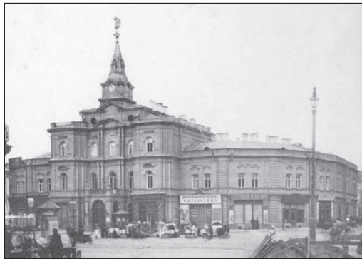
Будівля міської думи

перевагою для бізнесу та економіки міста. Додавали бонусів Києву як бажаному місцю проживання й розвинута міська інфраструктура (яка — ми побачимо далі — постійно розвивалася), наявність працівників (які приїздили тією самою залізницею або приходили пішки), місткий міський ринок (сформований тими самими мігрантами).