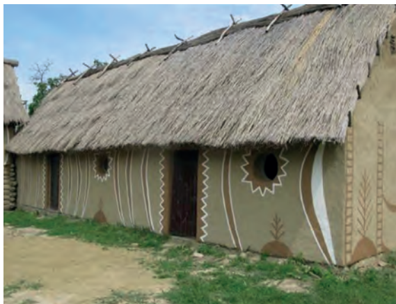
Реконструкція трипільського житла. с. Легеззине на Черкащині