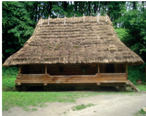
Бойківська хата з с. Орявчика. 18 ст. Львівський музей народної архітектури і побуту

Порушення цих законів неминуче призводять до пригнічення, затримки розвитку, ослаблення і руйнування живих