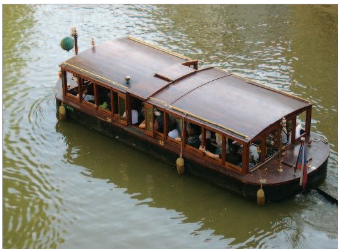
■ Туристический заезд по Влтаве

В Праге повсюду слышишь речь людей из разных стран. И всех она встречает одинаково гостеприимно.