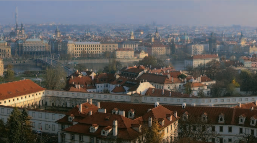
■ Рассвет над Прагой

дистых деревьев, и многочисленные театры, музеи, и рестораны и пивные, угощающие одним из старейших напитков.