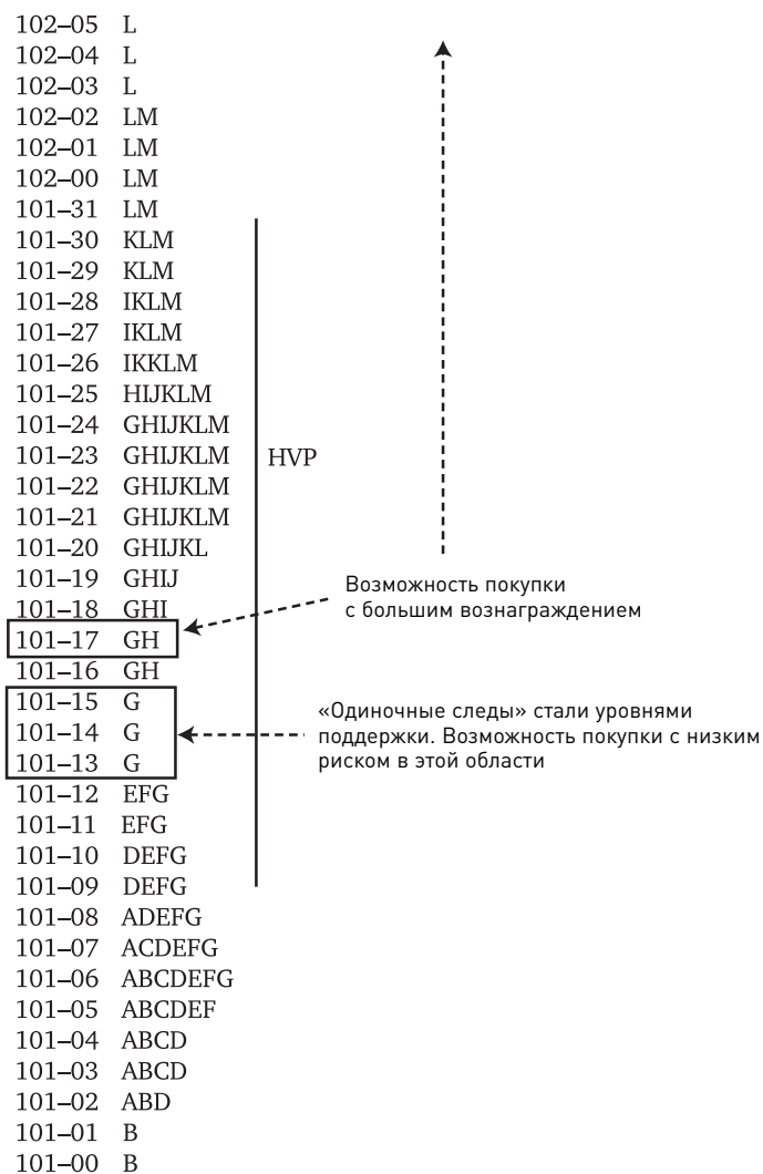
Рис. В. 4. День с двойным распределением

Подобно дням с нормальным распределением и бестрендовым дням, день с двойным распределением был еще одним типом торгового дня, подававшим ясные сигналы, которые можно было использовать, чтобы пожинать хорошую прибыль с небольшим риском.