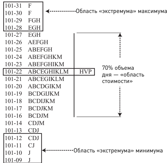
Рис. В. 1. День с нормальным распределением

Типы трейдеров. Во время торговых дней с нормальным распределением средний трейдер торгует в основном примерно в середине области стоимости, немного выигрывая и немного проигрывая — как правило, работая в ноль. Мой наставник как-то назвал таковых трейдерами «из дядюшкиной фирмы». Он объяснил это тем, что их нельзя уволить из-за кровного родства. Однако это же родство является причиной, по которой они не могут расти в должности внутри фирмы.