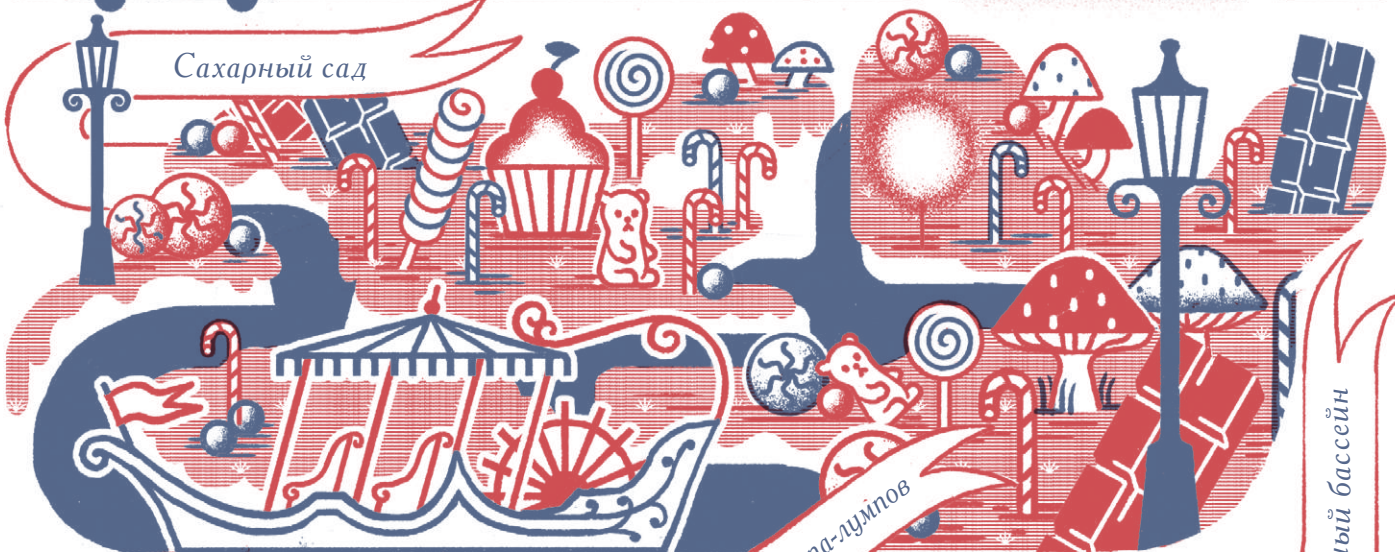
Водопад и шоколадная река