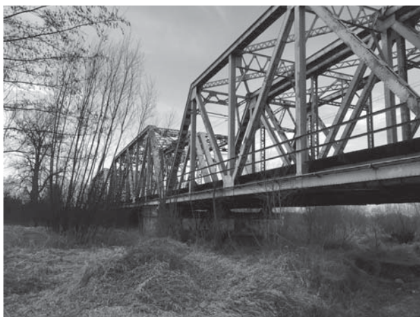
Мост через реку Солу

— Ты говорил, что знаешь, куда идти? — спросил Ян, наклонившись и тяжело дыша, когда Витольд и Эдек, наконец, догнали его 24 .