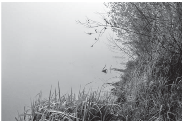
Висла на рассвете