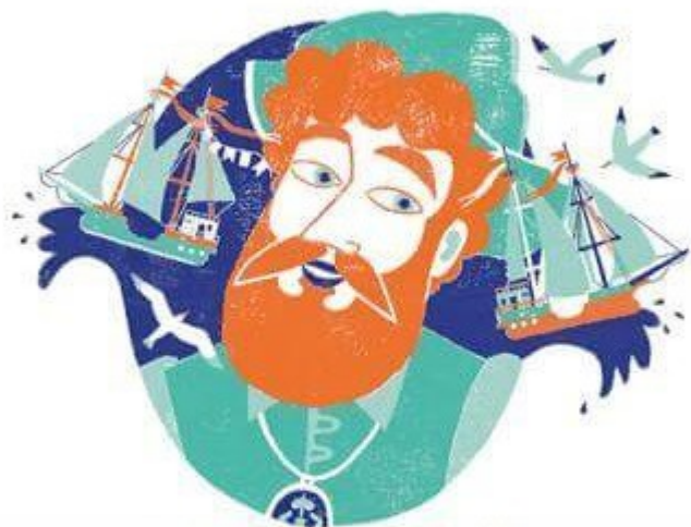
Фернан Магеллан 1480–1521