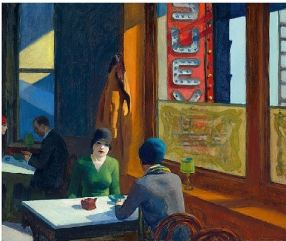
ЧОП СУЕЙ Едвард Гоппер, 1929

У XIX–XX століттях з'явилися нові матеріали. Завдяки цьому створювати картини можна було швидше й легше. А ще художники мали більше свободи при виборі сюжетів. Дехто з них прагнув зобразити простоту щоденного життя, як-от двох жінок за обідом.