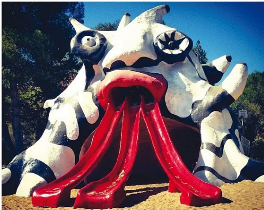
ГОЛЕМ (ЧУДОВИСЬКО) Нікі до Сен-Фаль, 1972

Три язики-гірки символізують три найпоширеніші в місті релігії — юдаїзм, іслам і християнство.