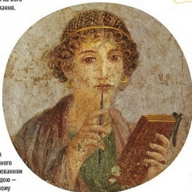
ПОРТРЕТ ДІВЧИНИ Невідомий давньоримський художник, бл.з. 55-79 н. е.

Техніка фрески відома з давніх-давен, а сам розпис може зберігатися дуже довго. Фреска праворуч створена майже дві тисячі років тому!