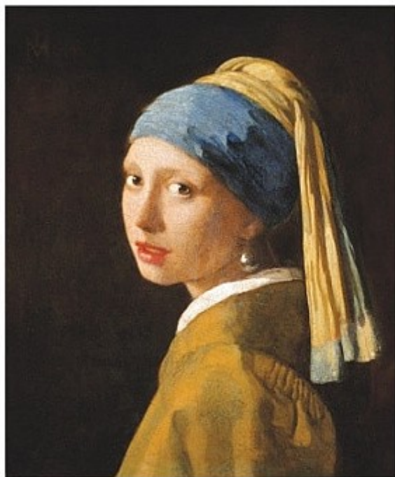
ДІВЧИНА З ПЕРЛИННОЮ СЕРЕЖКОЮ Ян Вермеєр, близько 1665

ОЛІЙНІ ФАРБИ з'явилися близько 600 років тому. Для їх виготовлення пігменти змішують із олією. Так утворюється напівпрозора кольорова субстанція, що дуже повільно сохне. Шар за шаром наносячи її, художники отримують значно точніші зображення, ніж ті, які створені іншими типами фарб. Коли було написано цей портрет, більшість митців уже послуговувалася олійними фарбами.