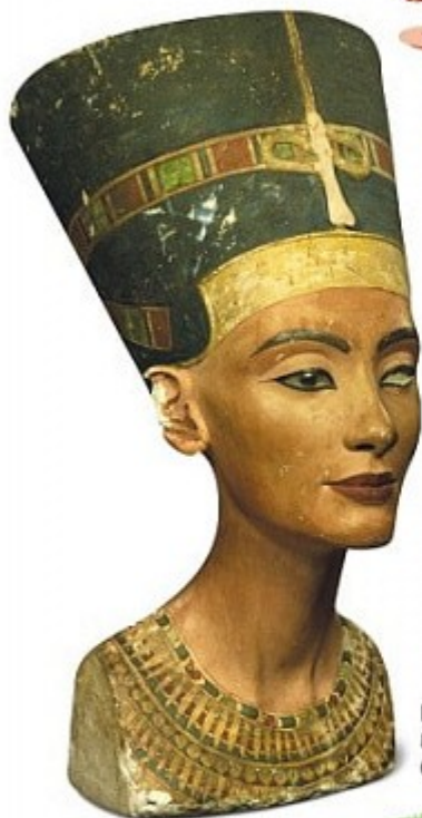
ЦАРИЦЯ НЕФЕРТИТІ Майстерня скульптора Тутмоса, близько 3370 років тому

У XV столітті європейські художники вже писали портрети й пейзажі. З часом їм вдалося зобразити дійсність усе більш і більш правдоподібно. Як саме? Розгорни книжку на сторінці 42 і дізнаєшся.