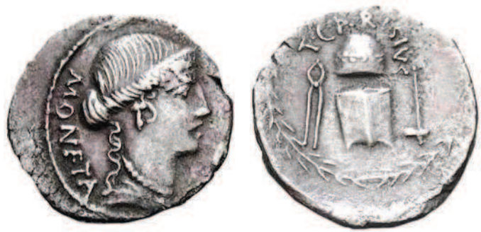
Рис. 1.10. Римский денарий «Юнона-монета», I век до н. э.

На римском денарии I века до н. э. с одной стороны изображена Юнона, а с другой — инструменты мастера монетного дела (рис. 1.10).