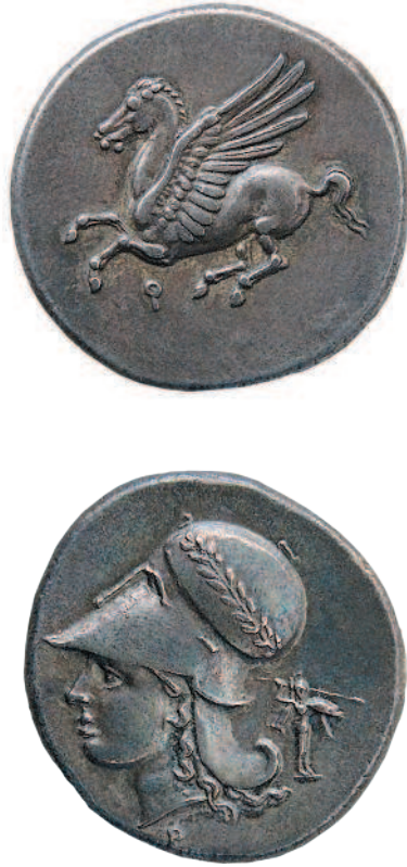
Рис. 1.7. Серебряная тридрахма из Коринфа, около 308–305 года до н. э.

Под изображением Пегаса видна буква «каппа» — первая буква названия города.