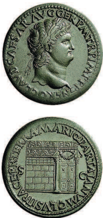
Рис. 1.13. Сестерций Нерона, 50-е годы I века н. э.

На аверсе монеты — характерный профиль Нерона, мнившего себя красавцем, гениальным поэтом и актером. На реверсе — закрытые ворота храма Януса: по традиции, ворота храма этого двуликого бога открывались, когда Рим вел войну, и закрывались в мирное время. Так что эта монета относится к одному из немногочисленных мирных периодов Рима (рис. 1.13).