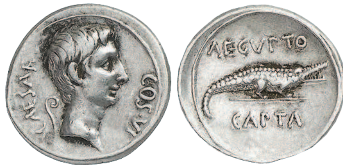
Рис. 1.12. Денарий Октавиана «Египет покорен». Серебро, 3,83 грамма. Около 27 года до н. э.

Так, покорение Египта было отмечено выпуском серебряного денария, на аверсе которого располагался профильный портрет правителя, а на реверсе — изображение священного Нильского крокодила и надпись «AEGVPTO CAPTA» — «Египет покорен» (рис. 1.12).