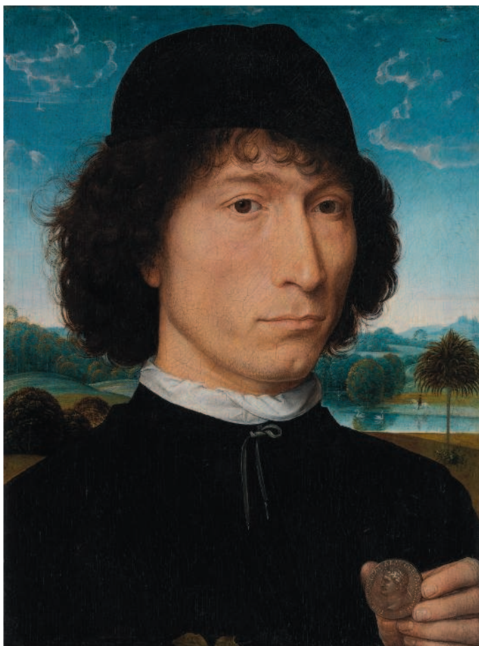
Ганс Мемлинг. Портрет мужчины с римской монетой. Ок. 1480 г.

ра (мастера, создававшего штемпели для чеканки монет или формы для их отливки). А знаете ли вы, что на большинстве монет есть также специальные знаки, которые расскажут о том, на каком монетном дворе изготовлено данное платежное средство?