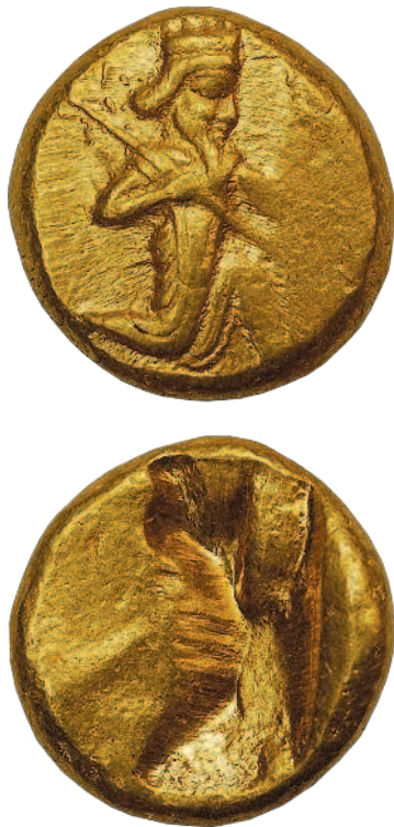
Рис. 1.3. Персидский дарик конца VI — начала V века до н. э.

В 547 году до нашей эры в государство Лидия, процветавшее под началом Креза, вторглись персы. Лидийское войско было разгромлено, и богатое царство исчезло с лица земли. Впрочем, персы унаследовали лидийские денежные стандарты, основав с опорой на них собственную счетно-денежную систему, наиболее известным «представителем» которой стал персидский дарик. Название получено, видимо, в честь персидского правителя Дария I, при котором начала выпускаться эта монета (рис. 1.3). Весила она чуть более 8 граммов и отличалась высоким содержанием золота. На монете был изображен коленопреклоненный царь, вооруженный луком. Дарики вскоре начали обращаться и за пределами персидской державы, а Дарий вошел в историю как первый правитель, увековечивший себя на монетах.