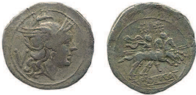
Рис. 1.11. Квинарий, III век до н. э. Цифра «V» слева от шеи Ромы указывает на равноценность этой монеты пяти ассам

Слово «квинарий» означает «содержащий пять (единиц)». Впервые такая монета появилась в 60-х годах III века до н. э. Изначально она равнялась пяти медным ассам, отсюда и название. На аверсе монеты — профиль богини Ромы, олицетворения города Рима; на реверсе — скачущие на конях близнецы Кастор и Поллукс, участники похода аргонавтов (Рим перенял многие элементы греческой мифологии) (рис. 1.11)