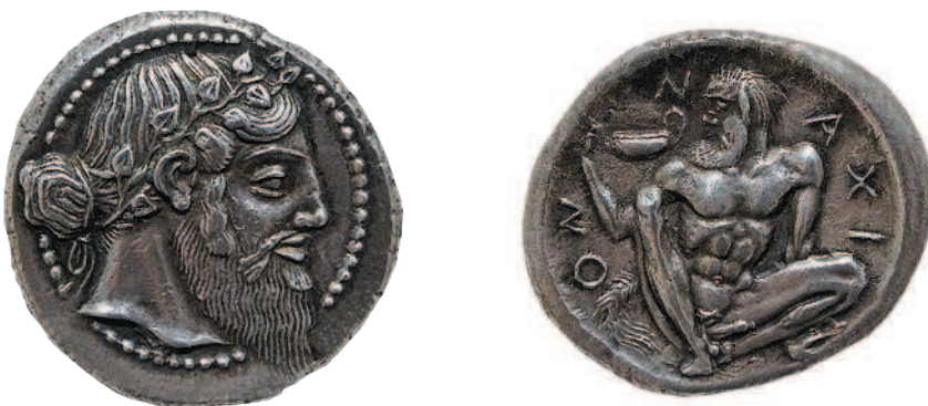
Рис. 1.8. Тетрадрахма «Дионис», около 460-х — 450-х годов до н. э. Стоимость — немногим менее миллиона долларов

Еще один шедевр античной монетной чеканки — серебряная тетрадрахма середины V века, изготовленная в греческой колонии Наксос на острове Сицилия. На одной стороне — голова Диониса, на другой — спутник и воспитатель веселого бога старик Силен (рис. 1.8).