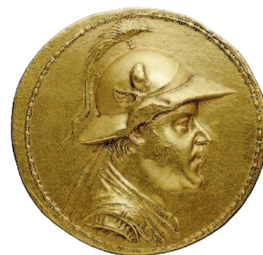
Рис. 1.9. 20 статеров Эвкратида I. Диаметр — 58 миллиметров, вес — около 170 граммов

тории Бухары, хранится в парижском Кабинете медалей.