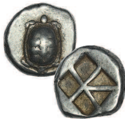
Рис. 1.4. Эгинский статер VI века до н. э.

На греческом острове Эгина монеты появились, видимо, на несколько десятилетий позже, чем в Лидии. Достоверно не известно, ориентировались ли жители Эгины на лидийские образцы или «изобрели» монеты независимо от соседей. Эта монета, изготовленная из серебра, весит около 12,5 грамма и имеет диаметр 20 миллиметров. На ней изображена черепаха: по легенде, родившаяся из морской пены Афродита впервые ступила ногой не на твердую землю, а на панцирь черепахи. Возможно, имен-