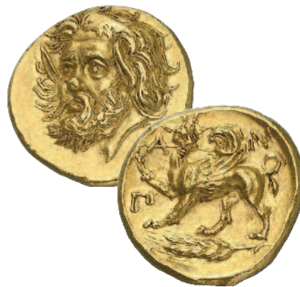
Рис. 1.5. Статер из Пантикапея (середина IV века до н. э.) — рекордсмен аукциона 2012 года

На золотой монете с одной стороны изображена голова сатира, а с другой — вооруженный копьем грифон и пшеничный колос (рис. 1.5). Вес монеты — чуть более 9 граммов. Это безусловный шедевр древней монетной чеканки.