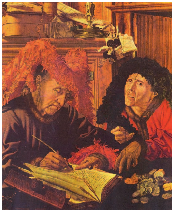
Маринус ван Реймерсвале. Сборщики податей. 1540-е гг.

Занятие нумизматикой сродни увлекательному детективному расследованию. Ведь далеко не всегда мы можем сразу разобраться в происхождении монеты, сходу определить ее стоимость. Приходится докапываться до истины при помощи ряда признаков: металл, из которого монета изготовлена, изображения на ней, разнообразные символы. Это могут быть инициалы минцмейстера (человека, отвечавшего за выпуск монет), медальера или граве-