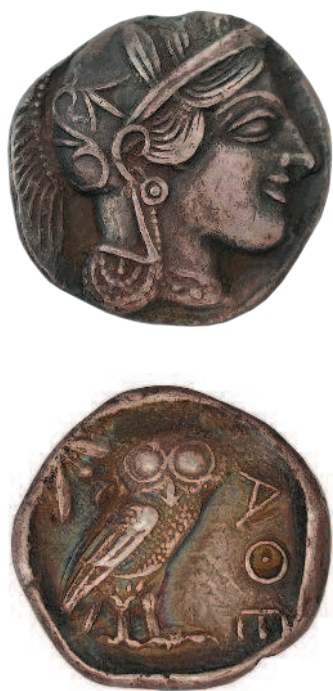
Рис. 1.6. Афинская тетрадрахма, середина V века до н. э.

Крупнейший город Греции считал своей покровительницей богиню Афины, поэтому ничего удивительного нет в том, что на тетрадрахме (монета достоинством в 4 драхмы) на аверсе изображена голова Афины, а на реверсе — спутница богини — сова, олицетворение мудрости. Рядом с совой можно рассмотреть оливковые ветви — по легенде, именно дерево оливы было главным даром Афины жителям этой местности (рис. 1.6). Это одна из известнейших разновидностей древнегреческих монет.