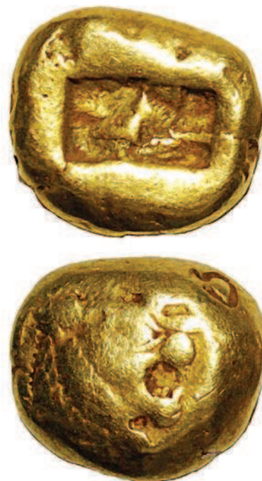
Рис. 1.1. Древняя лидийская монета трита — \frac{1}{3} статера, VII век до н. э. С одной стороны — два квадрата, с другой — голова льва (правда, полустершаяся за более чем 2,5 тысячи лет...)

диаметр около 13 миллиметров. \frac{1}{3} статера (она же трита, три-те) весила примерно 4,7 грамма, а \frac{1}{6} статера — 2,3 грамма. Именно так выглядели первые (из дошедших до нас) платежные средства Древнего мира, которые уже с полным правом можно назвать монетами! Откуда произошло название «статер»? Есть версия, что оно имеет санскритские корни и переводится как «постоянный», «крепкий». В любом случае, когда в Греции тоже начали чеканить монеты по образу и подобию лидийских, название «статер» использовалось и там.