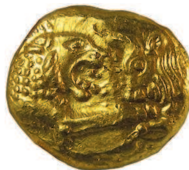
Рис. 1.2. Золотой статер Креза с изображениями льва и быка, VI век до н. э.

ражение «богат, как Крез» имеет под собой реальную историческую основу (рис. 1.2). Стоимость лидийских монет на аукционах начинается обычно от нескольких десятков тысяч долларов.