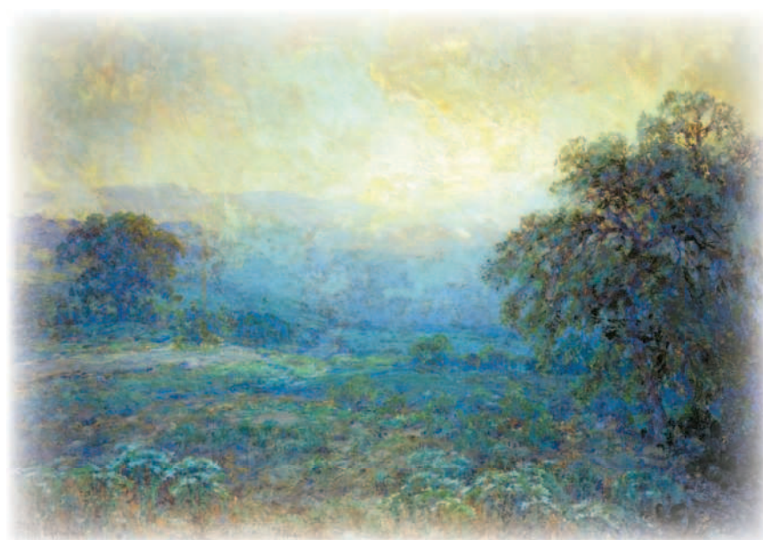
«Мальчишка силен духом и телом. Он не сможет жить среди холмов...»

Рассвет на холмах. Джулиан Ондердонк. 1922