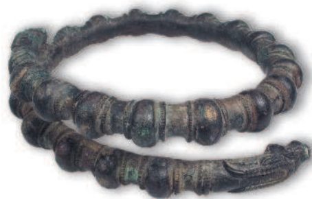
Руки широкоплечих воинов, явившихся перед Сетантой, были украшены многочисленными браслетами Кельтский браслет. Метрополитен-музей, Нью-Йорк

Вдруг один из них направился к Сетанте, позвякивая привязанным под коленом колокольчиком (вероятно, он помогал не потеряться в ночи). Незнакомец