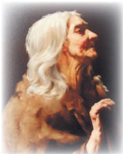
«Она выглядела маленькой и сморщенной, словно печеное яблоко»

Портрет старой женщины. Луиза де Хем. 1888