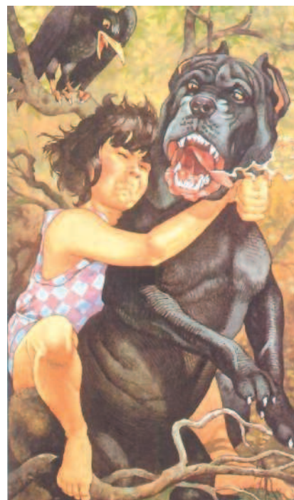
Сетанта борется с собакой Куланна. Джачинто Годензи. 1994

Кельтская мифология имеет ряд своих отличительных черт. Почти все объекты природы воспринимаются кельтами как места обитания мифических существ: здесь и полые холмы, населенные сидами, и волшебные дворцы на дне озер, и горные расселины, в ко-