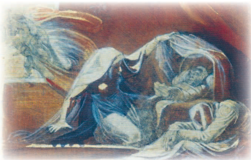
Сидам приписывают кражу и подмену детей на своих выкормышей

«Мы живем здесь с той поры, как бог Дамнейт и богиня Оссия произвели многочисленное потомство в лесах Ульстера» Олень. Альберт Бирштадт. Дата неизвестна