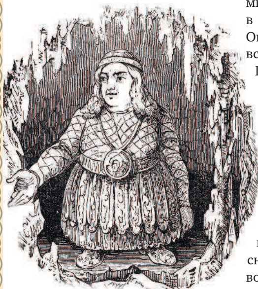
«Чужаки были ненамного выше Кухулина» Карлик. Гравюра на дереве. Харви Лич. Дата неизвестна

Юноша храбро защищался и даже поранил одного из чужаков, но те оказались сильнее.