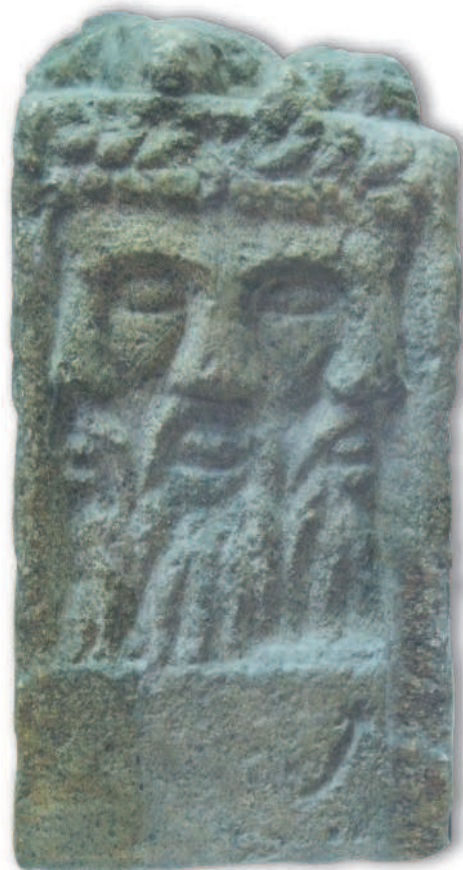
Алтарь, посвященный трехглавому богу, идентифицированному как Луг. Дата неизвестна. Реймс, Франция

Вторая часть посвящена преданиям о легендарных королях, которые еще больше приобщат вас к удивительной и самобытной истории кельтов. Кельтская мифология подарила нам богатое культурное наследие, которое будет интересно самым разным категориям читателей.