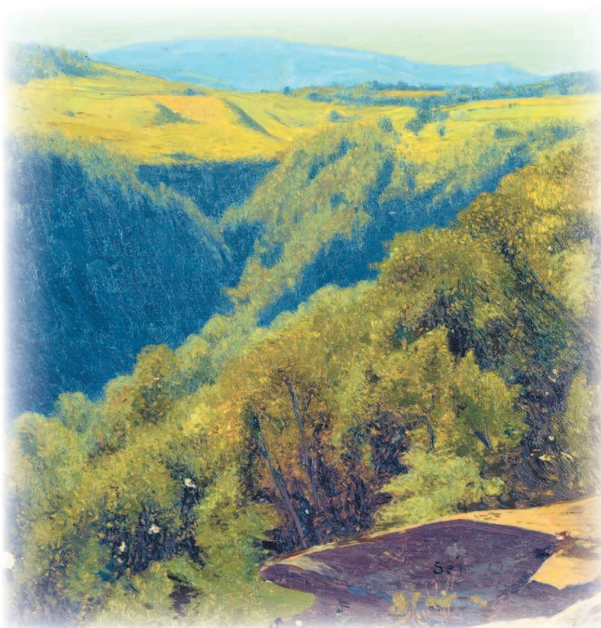
Согласно поверьям, некоторые сиды обитали внутри полых холмов Лето в горах. Джервис Макэнти. 1867