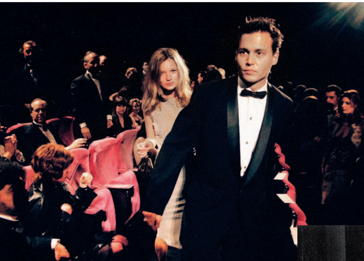
Депп с Кейт Мосс занимают места на показе фильма «Храбрец», его первой режиссерской работы, Канны, май 1997 года (слева); на премьере триллера «Жилец» с Вайноной Райдер, его невестой на тот момент, сентябрь 1990 года (ниже); с Ванессой Паради на премии «Оскар» 2008 года (напротив).

Игги до Уильяма Берроуза, Джека Керуака и других – о большинстве из них он узнал от своего старшего брата Дэниела, родившегося в 1953 году. Мосс хотела подарить ему экземпляр автобиографии Игги Попа в знак своей признательности. Спустя восемь лет у меня появилась возможность узнать у Деппа как у одного из последних безусловных сторонников контркультуры его историю культурного влияния. Мысль о Джонни Деппе как о бастионе ценностей поколения беби-бумеров (поколение родившихся в США после Второй мировой войны. – Прим. ред.) в какой-то мере объясняет его подход к актерскому мастерству, но это все еще оставляет огромное количество вопросов без ответов.