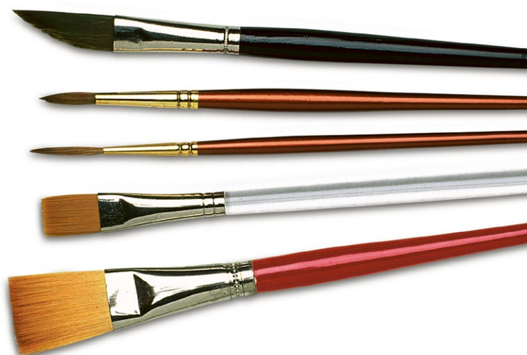
Сверху вниз: моя плоская кисть со скошенным краем; маленькая круглая кисть, лайнер, маленькая плоская и большая плоская кисти

Чаще всего при создании набросков я пользуюсь черными или коричневыми чернилами и тушью.