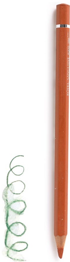
Акварельный или чернильный карандаш