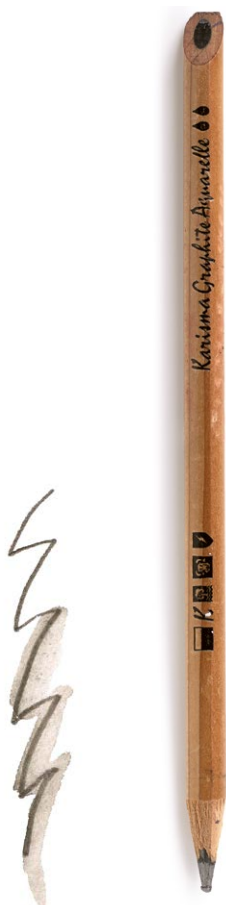
Водорастворимый графитовый карандаш