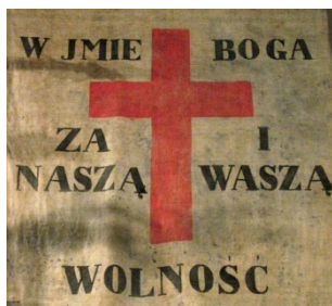
Прапор з написом (польською) «За нашу і вашу свободу»

11. Розгляньте зображення та дайте розгорнуті відповіді на запитання.