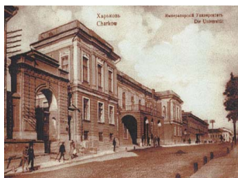
Будівля Харківського університету XIX ст.

11. Розгляньте зображення та дайте розгорнуті відповіді на запитання.