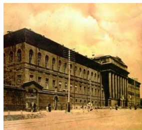
Будівля Київського університету XIX ст.

А) З якими суспільними процесами першої половини XIX ст. пов'язано зображене на ілюстраціях?