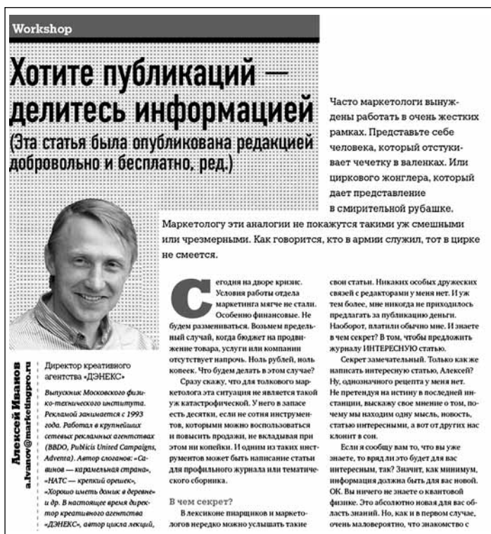
Рис. 1.1. Статья автора в журнале «МаркетингPRO»

И знаете, в чем секрет? В том, чтобы предложить журналу интересную статью. Вот так, например, выглядела моя работа на эту же тему в журнале «МаркетингPRO» (рис. 1.1). Ее подзаголовок: «Эта статья была опубликована редакцией добровольно и бесплатно». В исходном варианте его не было. Он был добавлен в самой редакции как наглядное доказательство того, о чем я писал.