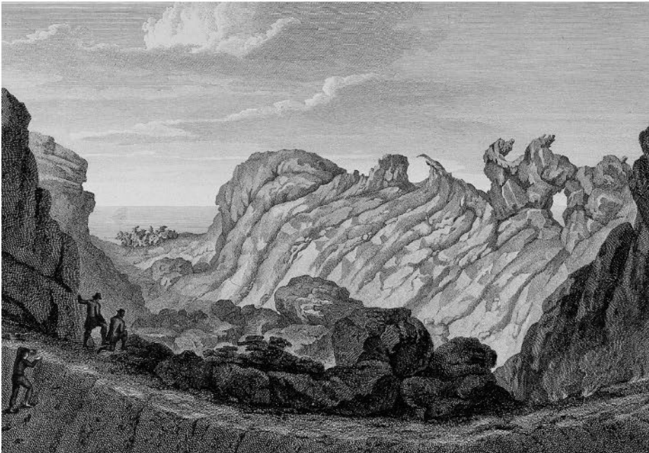
Гумбольдт и его спутники при восхождении на вулкан Пико-дель-Тейде (Тенерифе)

На высоте 18000 футов смельчаки увидели на камне последний клочок лишайника, приникший к валуну, после чего все признаки органи-