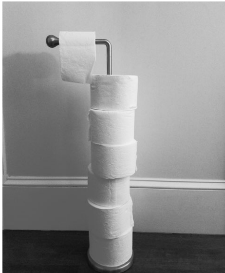
Рис. 7.1. Простое решение

Исправьте проблему — найдите более простое решение