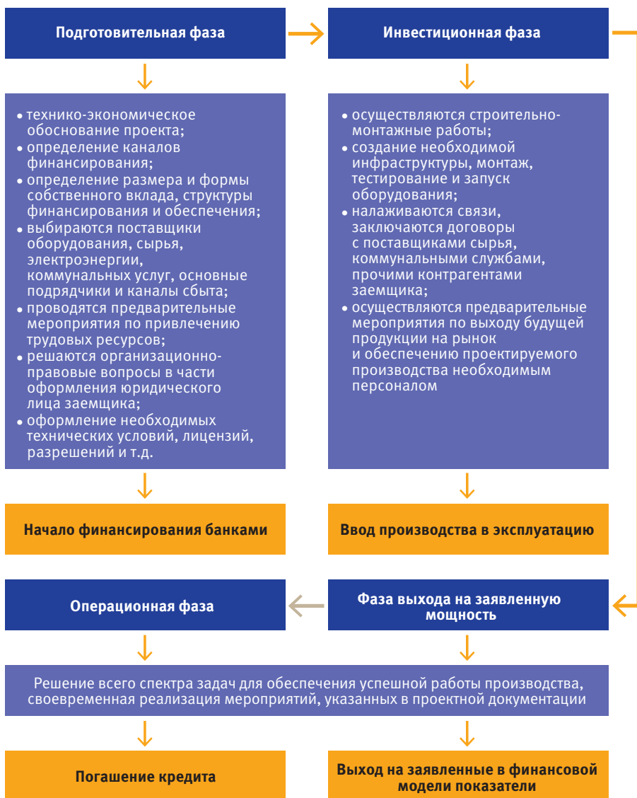
Рис. 1.1. Фазы реализации инвестиционного проекта