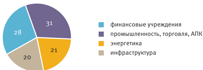
Рис. 1.2. Структура инвестиций ЕАБР, %

Евразийский банк развития осуществляет инвестиции в крупные эффективные средне- и долгосрочные проекты в шести странах. Минимальный размер проектов, принимаемых к рассмотрению, составляет, как правило, $30 млн с максимальным сроком окупаемости, как правило, не более 15 лет.