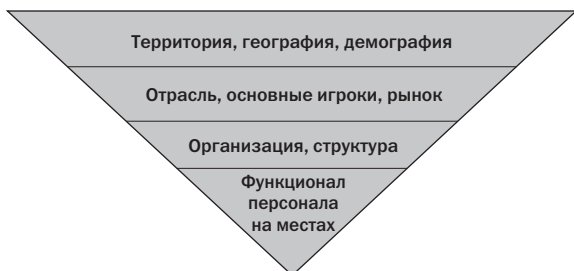
Схема « Контекстный анализ »