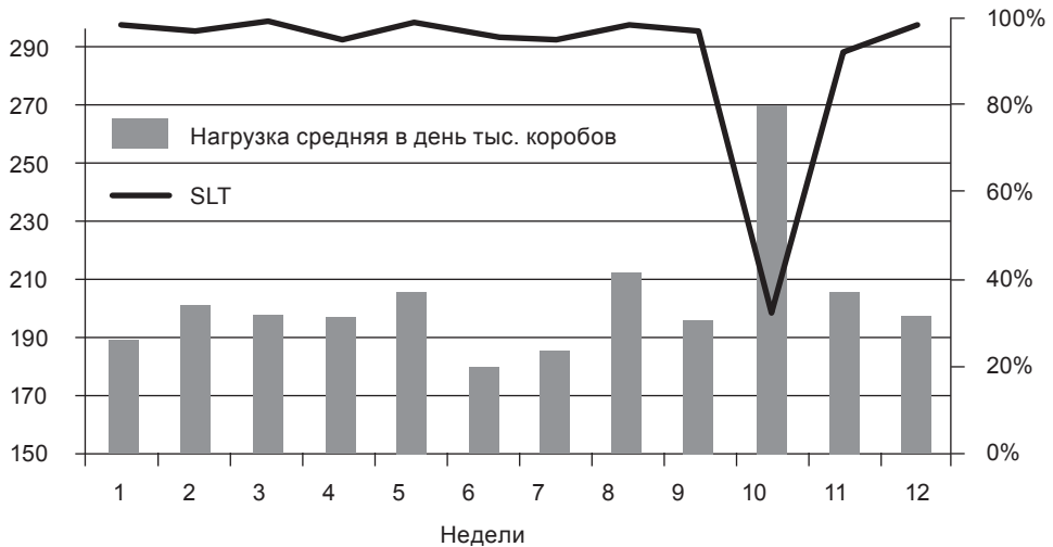
Рис. 1.2. Зависимость SLT от всплесков нагрузки на складе

Рассмотрим пример, к которому еще будем возвращаться, — РЦ (распределительный центр) розничной сети. Допустим, в день через склад проходит 200 000 коробов. Оператор работает классно, и SLT — основной показатель работы (уровень доставки в срок в магазины) колеблется около величины 97 %, как это показано на рис. 1.2.