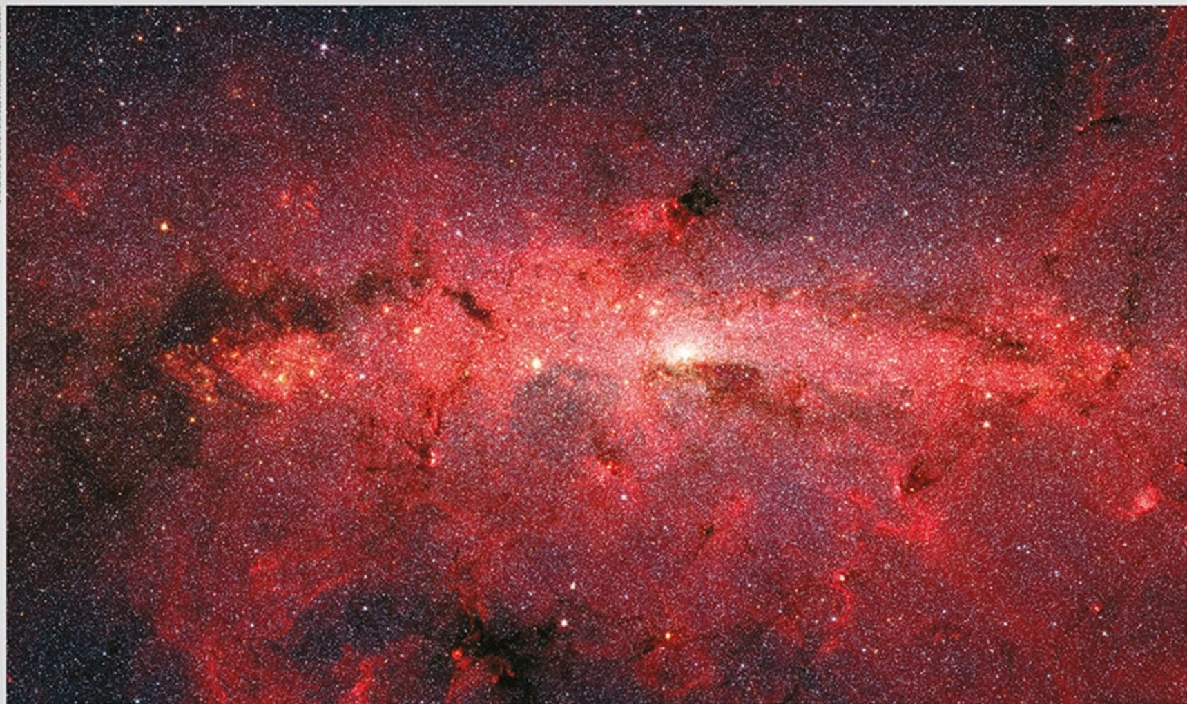
Центр Чумацького Шляху. Це неможливо побачити неозброєним оком, бо попереду його заступає космічний пил. Знімок було зроблено в інфрачервоному діапазоні, що дало змогу побачити сотні тисяч прихованих зірок. У межах білої цятки посередині міститься надмасивна чорна діра.