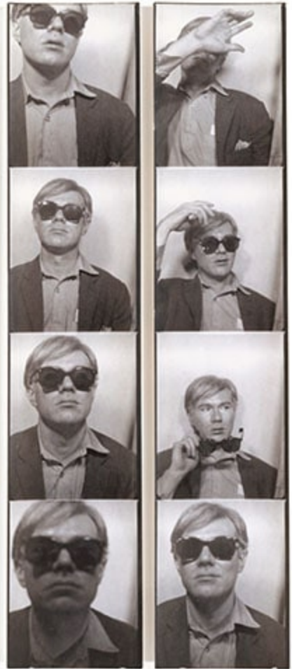
Автопортрет у фотокіоску Енді Воргол, бл. 1963 р.

Срібно-жовтий металевий відбиток 7 1/2 x 1 1/2 дюйма (19,6 x 3,8 см) кожен