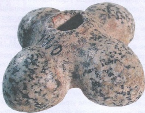
Булава, камінь. Трипільська культура, друга половина V тис. до н. е. Подніпров'я. Національний музей історії України

Бойовий молот та кинджал, мідь. Новоданилівська культура, друга половина V тис. до н. е. Село Петро-Свистуново, Запорозька область. Археологічний музей Інституту археології НАН України, Київ