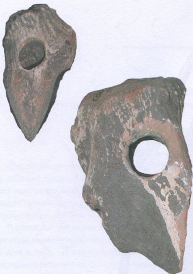
Молоти, ріг оленя. Дерейвська культура, кінець V — перша половина IV тис. до н. е. Село Дерейвка, Кіровоградська область. Археологічний музей Інституту археології НАН України, Київ

Військові конфлікти зафіксовано виключно на підставі археологічних джерел. Нижче згадано деякі з таких подій.