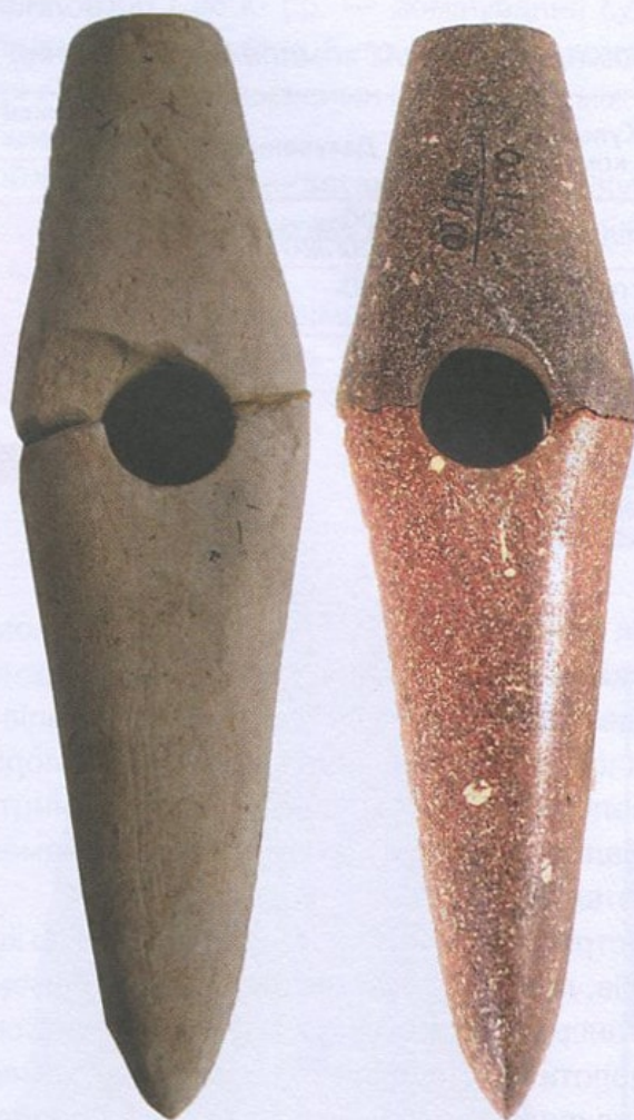
Сокири-молоти, камінь. Трипільська культура, кінець VI — початок V тис. до н. е.

1 — поселення Окопи, Тернопільська область; 2 — поселення Олександрівка, Одеська область