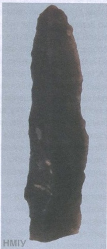
Мисливська зброя. Бойова частина вістря стріли. 13 600 років тому. Пізній палеоліт. Село Семенівка, Київська область

У скандинавській міфології, корені якої сягають дуже давніх часів, є образ могутнього бога Тора. Переможець крижаних велетнів мав на озброєнні чарівний бойовий молот, здатний знищити будь-якого ворога. Диво-зброя завжди поверталася до господаря, її можна було мета-