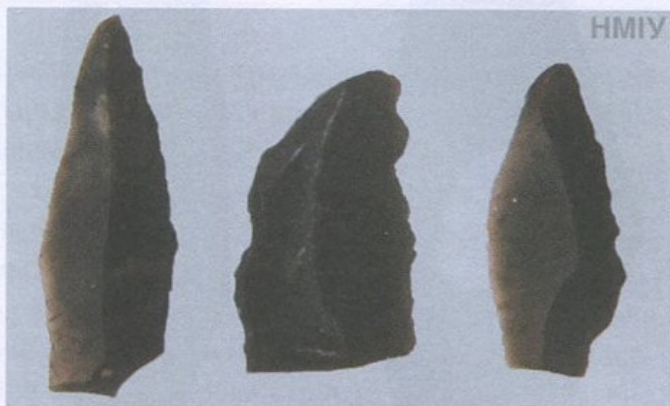
Вістря до стріл ланцетоподібні крем'яні. 15 тис. років тому. Пізній палеоліт. С. Мезін, Чернігівська область

На початку розглядуваного періоду з військовою метою використовували комплекс мисливського озброєння (КМО), до якого належали лук зі стрілами, дротики та спис. Як засіб «подвійного використання» побутували пласкі сокири. Їх застосування у війську зафіксоване для Європи даними біоархеології (травми на кістках загиб-