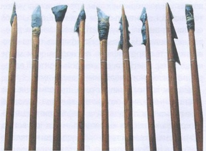
Стріли з крем'яними вістрями. Мезоліт (IX—VIII тис. до н. е.). Реконструкція Д. Нужного, Археологічний музей Інституту археології НАН України, Київ

вояків. У культурній спільноті Кукутень-Трипілля наприкінці V — у IV тис. до н. е. з'являються союзи племен — вождівства, здатні виставити по кілька тисяч воїнів (в окремих випадках до 3—7 тисяч). Ураховуючи концентрацію населення в протомістах (налічували до 15 тисяч мешканців), контингент у кілька тисяч вояків було зосереджено в окремому місці. До найбільш потужних складних вождівств долучалися сусіди-союзники, загальна кількість ополчення в такому випадку могла теоретично сягати 10 тисяч і більше осіб.