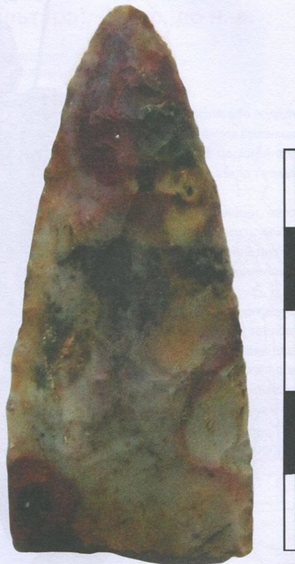
Вістря списа, кремій. Новоданилівська культура, друга половина V тис. до н. е. Село Петро-Свистуново, Запорозька область. Археологічний музей Інституту археології НАН України, Київ

Близько 3400 р. — встановлення домінування в Буго-Дніпровському межиріччі трипільців із заходу.