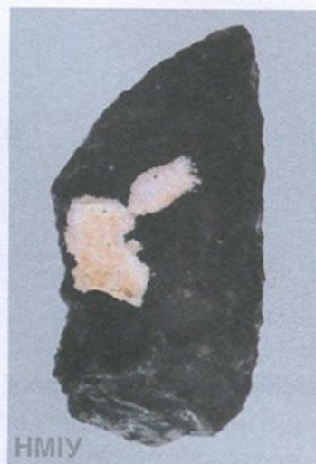
Мисливська зброя. Гостроконечник крем'яний. 70 тис. років тому. Середній палеоліт. Кабазі V. С. Малинівка, Крим

ти знову й знову. Цікомі реальні прототипи легендарного молота було вперше розроблено (і широко застосовано) на теренах Європи наприкінці VI тис. до н. е, тобто приблизно сім тисяч років тому, після чого впродовж майже трьох наступних тисячоліть вони залишалися на озброєнні воїнів багатьох племен. Це була історична подія, адже від тих часів можемо вести відлік доби спеціалізованої зброї, призначеної виключно для війни. Її застосування вимагало нових навичок, постійних тренувань, нарешті, певних зрушень у свідомості — як того, хто її застосовував, так і суспільства в цілому, яке долучилося до процесу, називаного словом «війна». Бойова сокира-молот швидко стала символом влади, її постійно вдосконалювали — на зміну каменю прийшов метал (спочатку мідь, потім — бронза, далі — залізо), невідомі нам «конструктори» розробляли нові обриси — більш смертоносні і водночас такі, що вабили досконалістю форм. Так народжувалася та магія зброї, яка не залишає байдужим та бентежить і сьогодні кожного, хто споглядає зброю або торкається до неї.