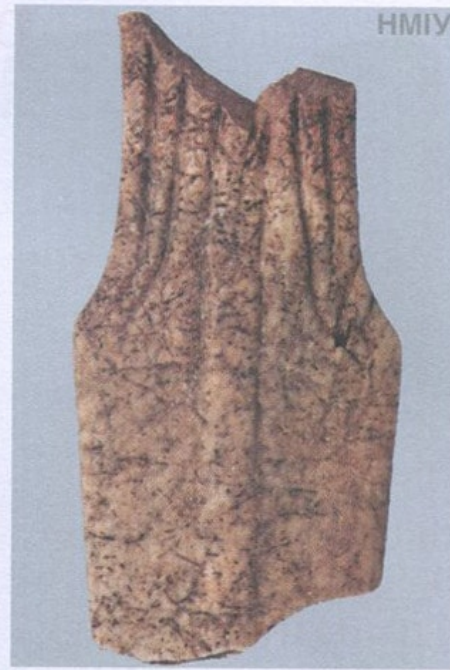
Кинджал кістяний (ф)рагмент). Кінець IV тис. до н. е. Трипільська культура. С. Грим'ячка, Хмельницька область

Разом із тим виявляється, що описана ще давньоримськими авторами тактика ведення бою германців та слов'ян, а також притаманний їм комплекс озброєнь сягають часів існування (до речі, на тій самій території) культури кулястих амфор, а це III тис. до н. е. Притаманний згаданим культурам комплекс озброєнь: лук зі стрілами, дротики, сокира для ближнього бою — збігається до дрібниць (із тією лише різницею, що креміль, камінь та кістку у виготовленні озброєння через чотири тисячі років було замінено на залізо).